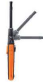
Humedad / Temperatura t-605i